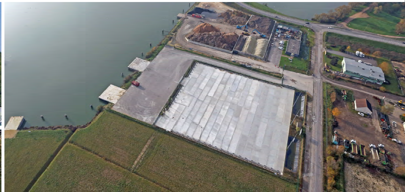
TERRE-PLEIN MULTIVRAC - PHOTO AERIENNE OBLIQUE