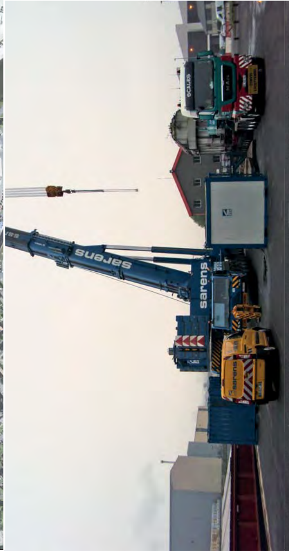
QUAI A USAGE PARTAGE 1