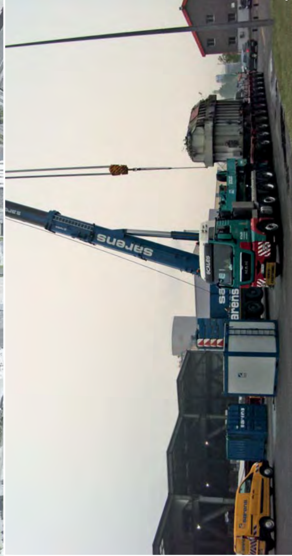
QUAI A USAGE PARTAGE 1