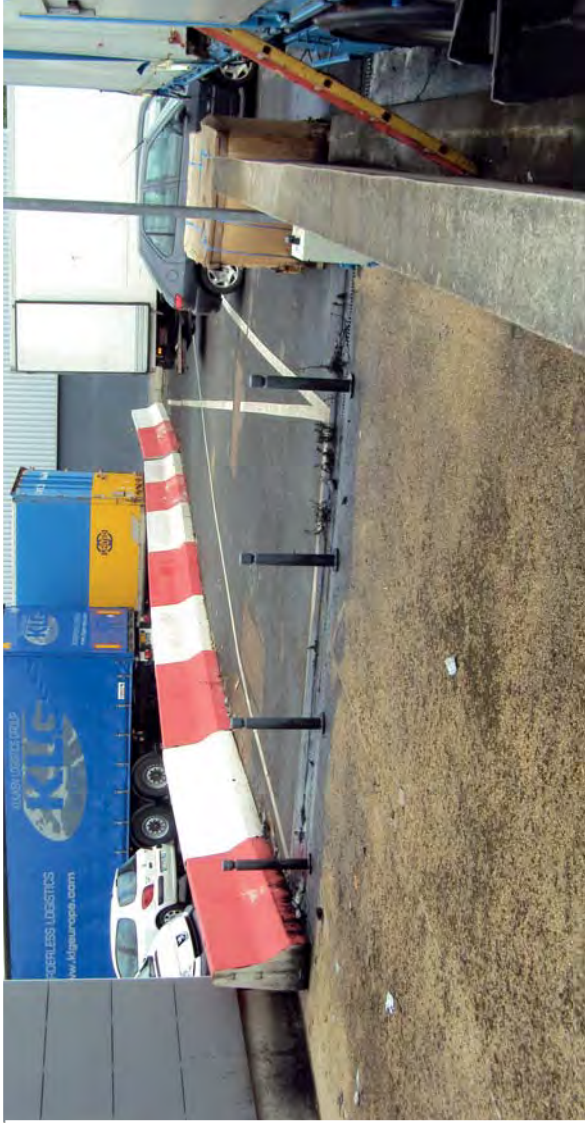
QUAI A USAGE PARTAGE 2