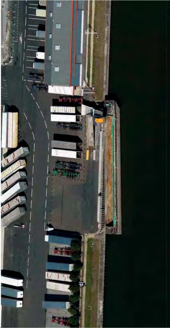
QUAI A USAGE PARTAGE 2

Réservation Agence Seine Amont Tél. : 01.43.39.02.50