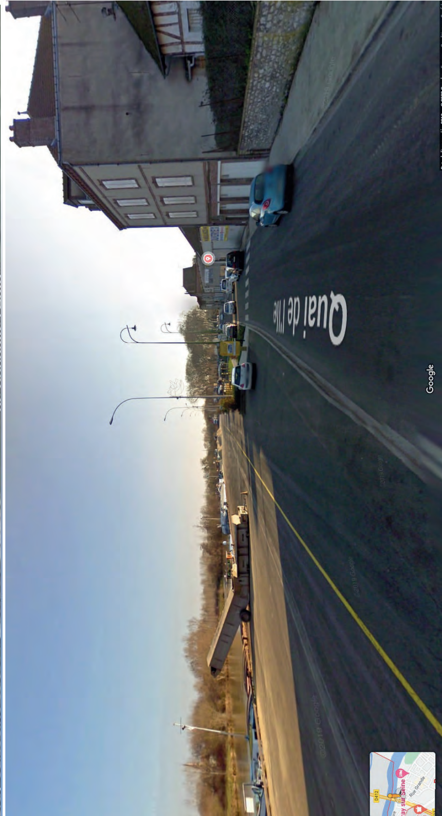
QUAI A USAGE PARTAGE - VUE QUP_3 (17 quai de l'île)