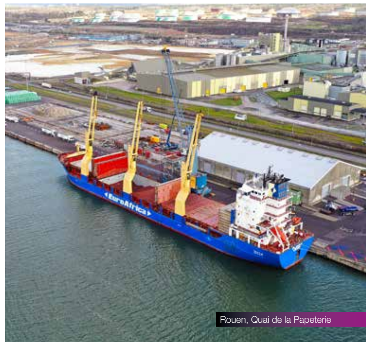
Rouen, Quai de la Papeterie

Plateforme collaborative électronique appelée Port Community System (PCS) de 4 e génération, le Guichet unique portuaire (GUP) offre désormais un seul point de connexion à l'ensemble des parties prenantes de la chaîne logistique. Accessible 24/24 et totalement automatisé, ce guichet assure la transmission instantanée et le partage des informations pendant les opérations portuaires. Il permet une gestion fluide et rationalisée de la chaîne d'approvisionnement, contribue à la décongestion des ports et offre aux clients une libération plus rapide de leurs marchandises.