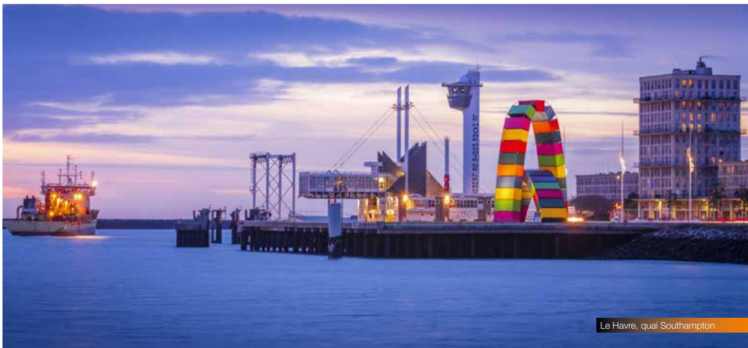
Le Havre, quai Southampton

sur des thématiques d'attractivité du territoire, d'innovation et de développement économique.