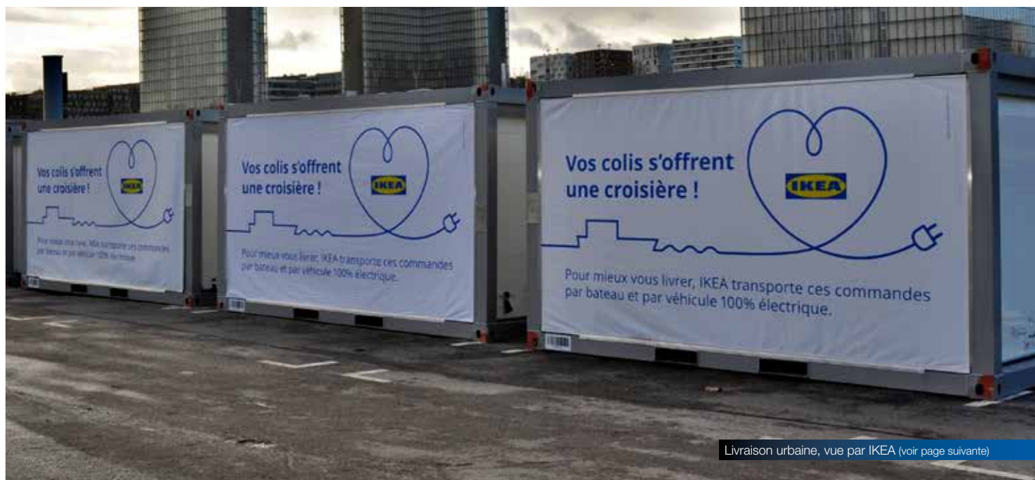
Livraison urbaine, vue par IKEA (voir page suivante)

Pour encourager les chargeurs à utiliser le fleuve, les conteneurs évoluent . Repliables, les conteneurs flat rack sans parois latérales fixes ni toiture s'adaptent aux marchandises volumineuses, se chargeant par le haut ou les côtés. Pour le bois, Sogestran a conçu FlexiMalle, une structure bâchable aux parois rabattables et amovibles d'une capacité de 7 tonnes.