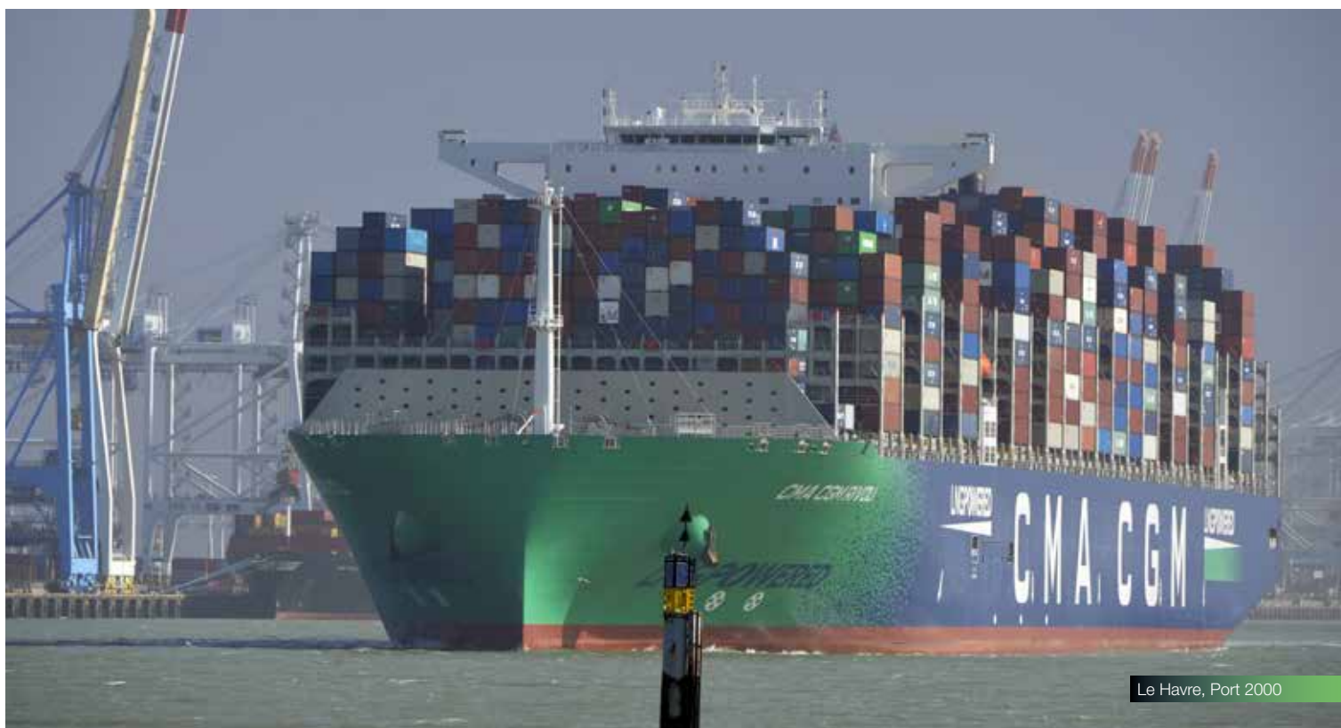
Le Havre, Port 2000

À la suite d'un appel à projets lancé par HAROPA PORT, ENGIE implanté des stations multi-énergies à Limay-Porcheville et Gennevilliers, incluant une unité de production d'hydrogène. L'entreprise Distry de son côté en installera à Bonneuil-sur-Marne, Bruyères-sur-Oise et Montereau-Fault-Yonne. Ces stations complètent celles existantes le long de l'axe Seine , et notamment la station d'avitaillement GNV implantée sur la zone industrialo-portuaire du Havre à proximité des parcs logistiques.