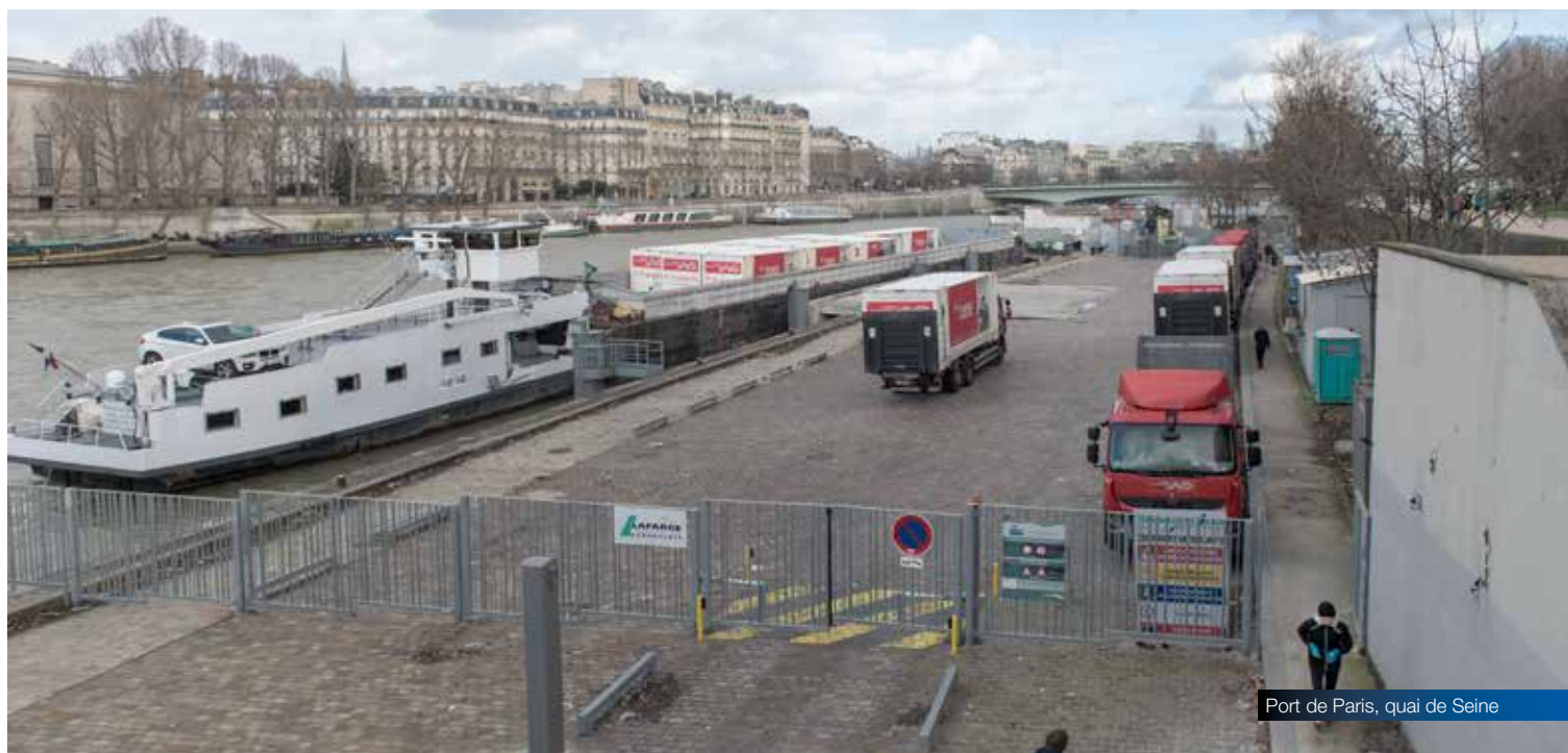
Port de Paris, quai de Seine