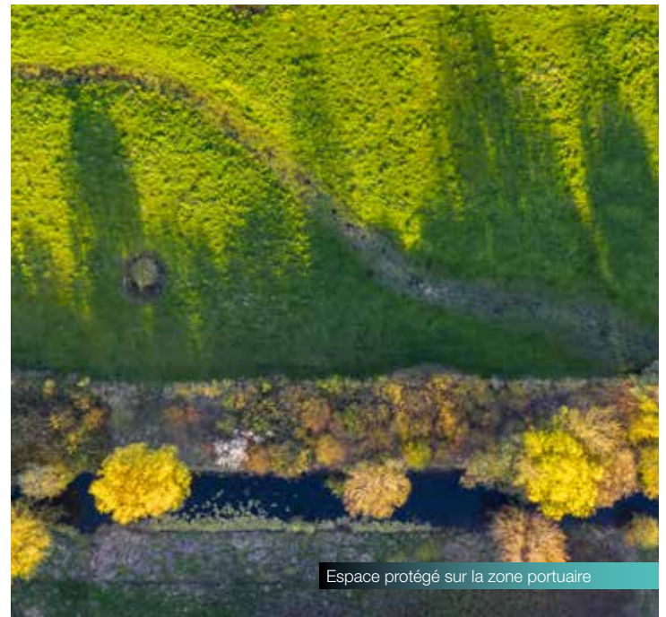
Espace protégé sur la zone portuaire

HAROPA PORT participe au Programme d'action pour le climat des ports mondiaux (World Ports Climate Actions Program - WPCAP), engagement volontaire de 13 ports internationaux qui, ensemble, veulent ouvrir la voie et contribuer à l'élaboration de futurs standards. Ces travaux collectifs constituent une condition indispensable pour agir vite et efficacement. Parmi les priorités : le branchement électrique à quai des navires, pour améliorer la qualité de l'air et réduire les émissions de CO 2 dans le port.